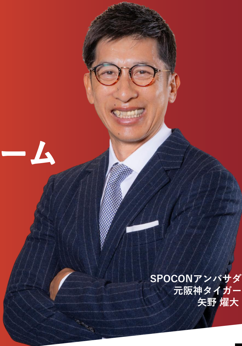
SPOCONアンバサダー 元阪神タイガース 矢野 耀大 氏